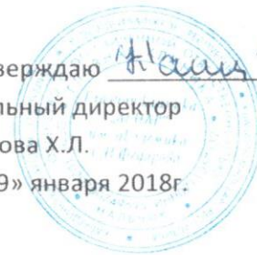
График работы врачей ООО Глазная клиника «ЛЕНАР» им. академика С. Н. Федорова